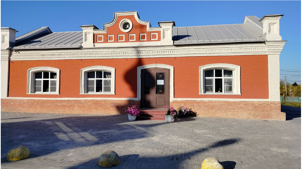
Фото 1. Объект культурного наследия регионального значения «Лавка купца Шатагина» (Нижегородская область, Дивеевский район, с. Дивеево, пер. Прудовый, 3 а)