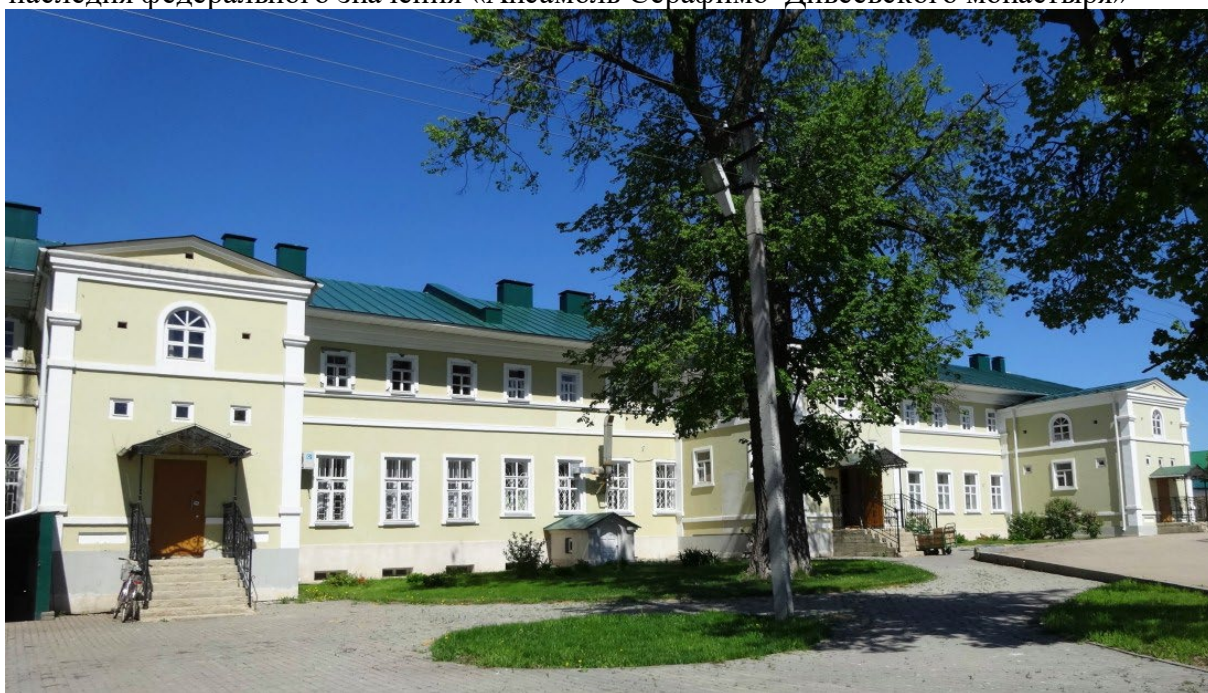
Фото 3. Объект культурного наследия федерального значения «Хлебный корпус», вторая половина XIX в. (Нижегородская область, Дивеевский район, с. Дивеево, ул. Советская, 13 (литера А)), входящий в состав объекта культурного наследия федерального значения «Ансамбль Серафимо–Дивеевского монастыря»