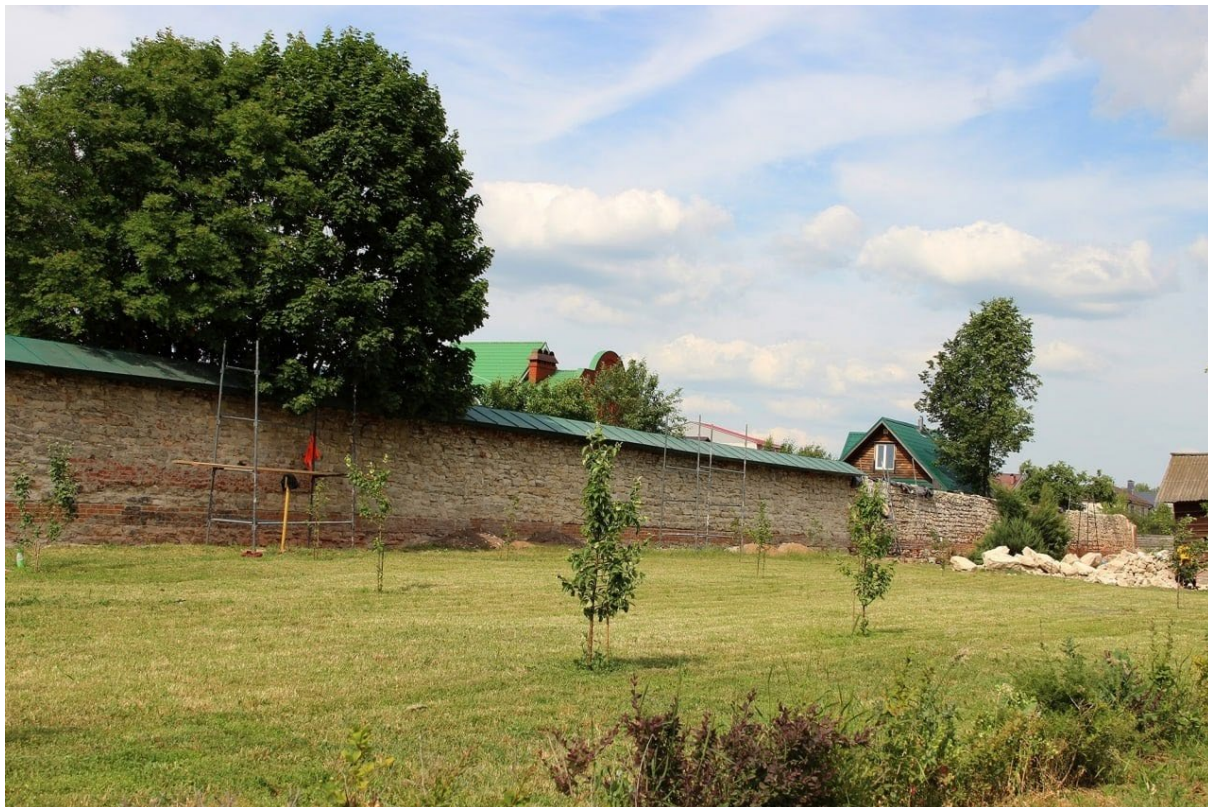
Фото 2. Объект культурного наследия федерального значения «Северная ограда», конец XIX в. (Нижегородская область, Дивеевский район, с. Дивеево, Свято-Троицкий Серафимо-Дивеевский монастырь (литера I)), входящий в состав объекта культурного наследия федерального значения «Ансамбль Серафимо–Дивеевского монастыря»